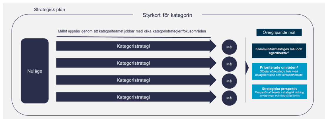
Figur 3 – SVOA:s styrmodell för kategoriarbetet.

Nedan bild visar modellen för det strategiska arbetet i kategorin.